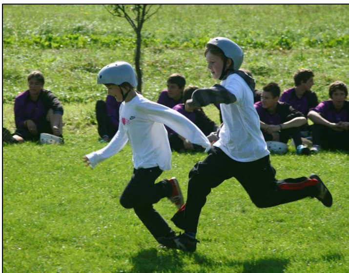
Momentky ze soutěže v Rokytnici