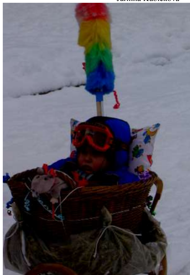
nejoriginálnější sjezdař sněžné jízdy