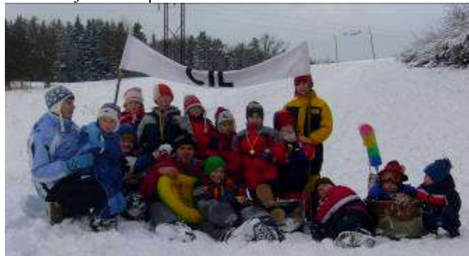
účastníci sněžné jízdy